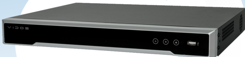
NVR-H2162 Rejestrator sieciowy 16-kanałowy